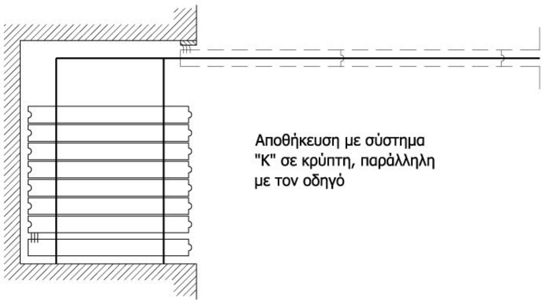
Αποθήκευση με σύστημα "K" σε κρύπτη, παράλληλη με τον οδηγό